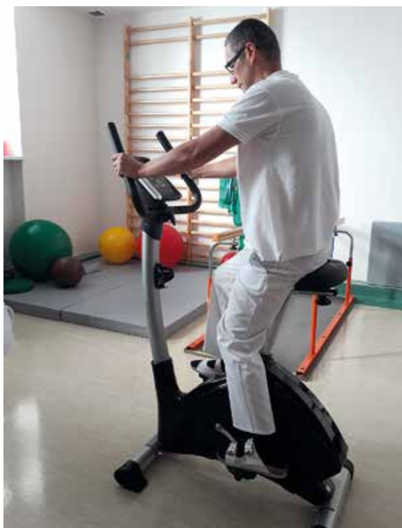
Ryc. 4. Leczenie miażdżycy tętnic kończyn dolnych – trening na ergometrze rowerowym

W piśmiennictwie można znaleźć prace, których wyniki przemawiają za tym, że trening kończyn górnych ( arm cranking ) może być wysoce korzystnym postępowaniem u chorych z chromaniem kończyn dolnych. Dotyczy to w szczególności wielu pacjentów z PAD, którzy źle tolerują marsz lub mają ograniczoną możliwość wykonywania ćwiczeń kończyn dolnych. Wykazano, że ćwiczenia kończyn górnych wzmagają potencjał antyoksydacyjny i prowadzą do wydłużenia bezbólowego i maksymalnego dystansu chromania. Z całą pewnością można oczekiwać też, że ta forma treningu przyczynia się do wzmocnienia mięśni kończyn górnych, ewentualnej normalizacji ciśnienia i usprawni układ krążenia jako całość. Obciążenie powinno być tak dobrane, aby uzyskać optymalne warunki dla trenowania układu sercowo-naczyniowego. Określa je tzw. strefa sprawności fizycznej definiowana jako 50–75% maksymalnej CAS (220 – wiek) i taki zakres uważa się za docelową czynność serca. Zwiększenie CAS powyżej górnej granicy strefy sprawności może stanowić ryzykowne obciążenie mięśnia sercowego [45, 46].