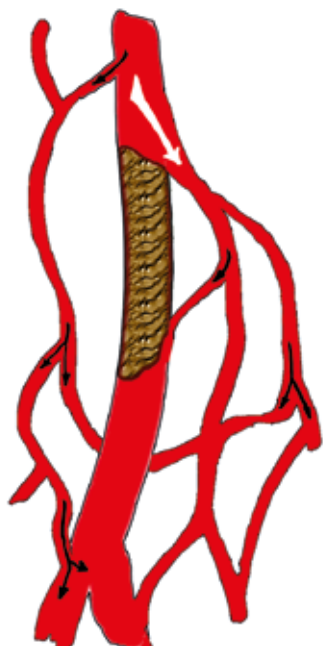
Ryc. 1. Krążenie oboczne. Krew dopływa do tętnicy poniżej miejsca niedrożności przez sieć pobliskich tętnic

u osób z chorobami układu krążenia zagrożonych powikłaniami sercowo-naczyniowymi [3]. A zatem kinezyterapia u chorych z miażdżycowym niedokrwieniem kończyn dolnych powinna być prowadzona nie tylko na podstawie rehabilitacji zaburzeń narządu ruchu, lecz także uwzględniać elementy programu rehabilitacji kardiologicznej.